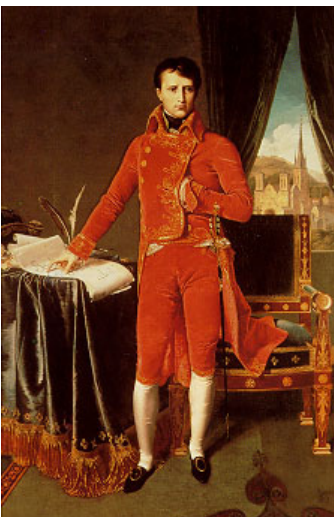
Retrato de Napoleón Bonaparte por Jean-Auguste-Dominique Ingres, 1804.

Napoleón Bonaparte (1769 - 1821) fue emperador de Francia, un militar y un hombre de estado. Siguió la carrera militar y se graduó en la Academia de París en 1785. Tras el triunfo de la Revolución Francesa (1789) simpatizó con el nuevo régimen, pero fracasó en su intento por intervenir contra el nacionalismo. Implementó múltiples e importantes reformas: un nuevo código tributario, el banco central, leyes, un sistema de carreteras y cloacas, etc.